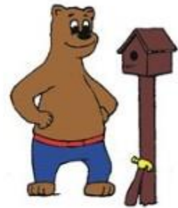
Ik kijk mijn werk na. Wat vind ik ervan?