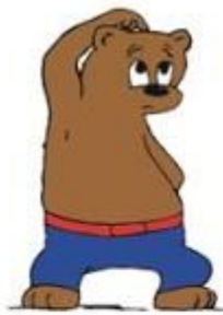
Wat moet ik doen?