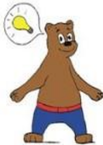
Hoe ga ik het doen?