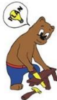
Ik doe mijn werk