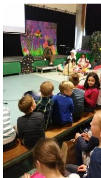
Alice in Wonderland